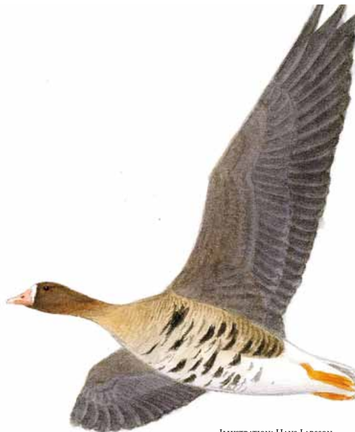
ILLUSTRATION: HANS LARSSON