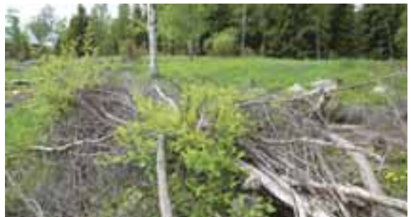
Återväxten skyddas mot älg med utlagda rishögar.