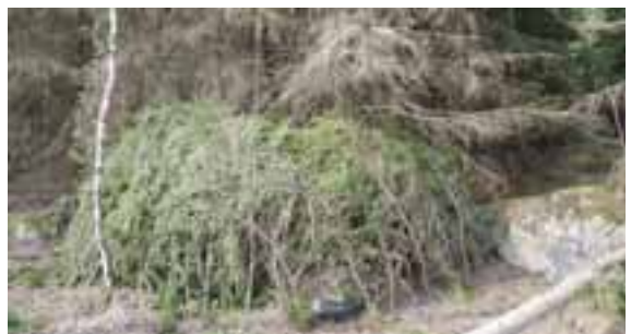
Eventuella granhögar läggs långt in i brynet.