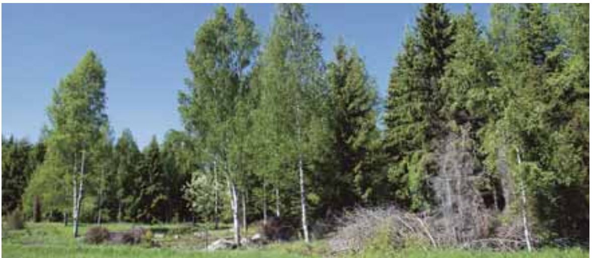
Brynet är fixat och färdigt. Nu kan det växa upp till ett drömbryn.