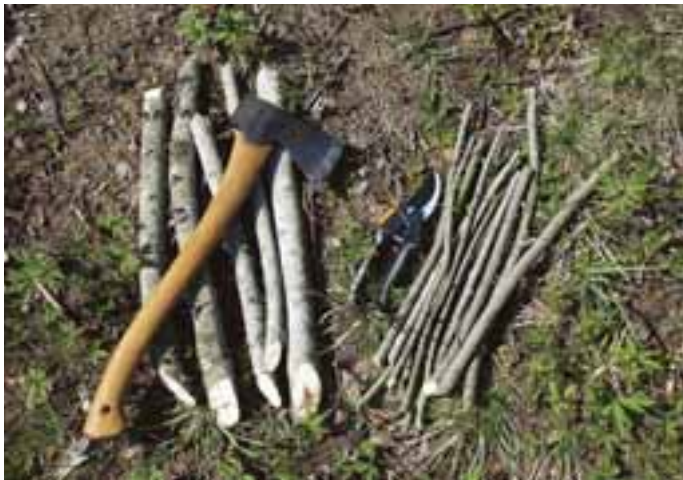
Sticklingar är ett utmärkt sätt att skapa skydd och foder åt viltet.

Man kan också köpa sticklingar eller plantor. Många av de mer snabbväxande sorterna ställer dock ganska höga krav på jordmån, isynnerhet om man skall få den utlovade tillväxten. Undvik