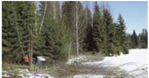
Arbetet igång. Målet är ett sluttande bryn.