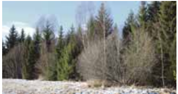
Utgångsläget. Bryn saknas.

6. SKYDD FÖR VILTET. När man restaurerar ett helt igenvuxet bryn så försvinner mycket av skyddet för viltet, eftersom det ofta saknas ett befintligt buskskikt som man kan plocka fram. Ett enkelt sätt att skapa skydd tills nya buskar etablerats är att samla ihop röjda stammar och buskar i högar. Börja gärna med toppar eller litet kraftigare stammar, som gärna får ligga på stubbar eller stenar. Därmed skapas mer utrymme under rishögen. Högarna utnyttjas som skyddade boplatser för fåglar